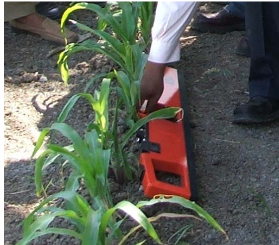
Gambar 5. Pengukuran menggunakan EM38 dengan posisi rebah