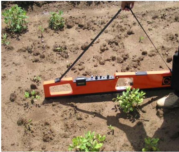
Gambar 2. Pertumbuhan tanaman yang buruk akibat salinitas di Pante Raja, Pidie. Nampak pengukuran salinitas menggunakan alat EM38.

Tingkat salinitas tanah di daerah yang terkena dampak tsunami sangat bervariasi. Jenis dan daya tumbuh tanaman dapat dipakai sebagai indikator untuk tingkat salinitas tanah. Pertumbuhan bibit tanaman umumnya tidak merata di tanah yang salinitasnya tinggi (Gambar 2) dan hanya tanaman yang toleran terhadap salinitas yang dapat bertahan hidup (Gambar 3). Indikator salinitas tanah yang lain termasuk akumulasi butiran garam di permukaan tanah dan penampilan tanah kering yang seperti tepung/bedak kalau diinjak. Tetapi, jika tanah yang salin tersebut telah diolah indikator tersebut tidak akan terlihat.