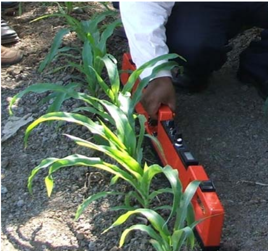
Gambar 4. Pengukuran menggunakan EM38 dengan posisi tegak