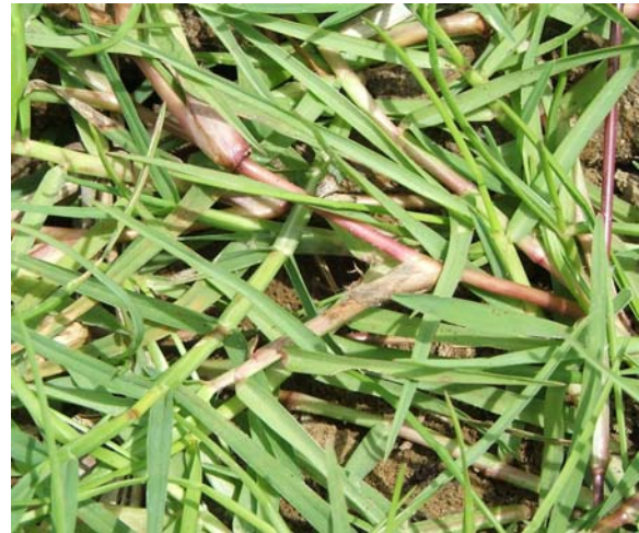
Gambar 3. Rumput yang toleran terhadap salinitas di desa Brebang, Pidie.