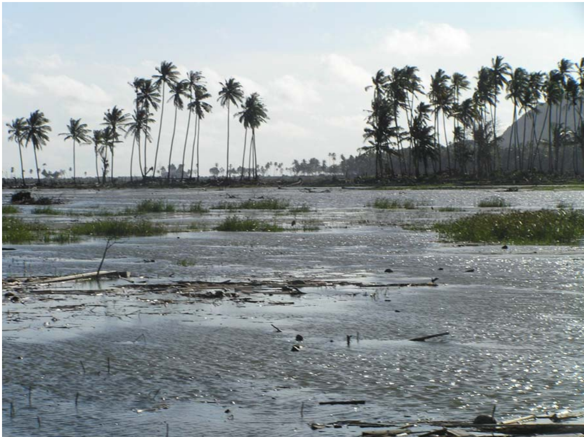
Gambar 1. Daerah yang terkena dampak tsunami di Lho Nga, Aceh Besar

Tsunami yang terjadi di Samudra Hindia pada tanggal 26 Desember 2004 mengakibatkan lahan-lahan berelevasi rendah di sepanjang pantai timur dan barat Provinsi Nanggroe Aceh Darussalam (NAD) tergenang air laut. Lahan-lahan di daerah ini sekarang kembali digunakan untuk kegiatan pertanian, akan tetapi beberapa lahan tersebut ternyata masih mempunyai tingkat salinitas (kadar garam) yang terlalu tinggi untuk pertumbuhan tanaman. Melalui sebuah proyek kerjasama, para ahli pertanian dari Indonesia dan Australia telah mengembangkan cara yang cepat untuk mengukur salinitas tanah di daerah yang terkena dampak tsunami dan memperkirakan tingkat pencucian garam-garam yang telah terjadi sejak peristiwa tsunami.